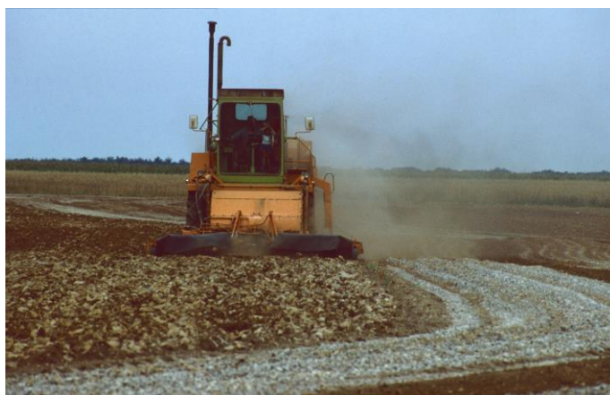
Selbstfahrender Feldsteinbrecher Baujahr 1976 System Müller, Königheim-Pülfringen