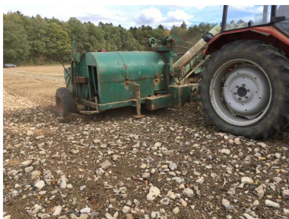
Steinsammelmaschine, Baujahr 1968, konstruiert von Josef Müller, Königheim-Pülfringen